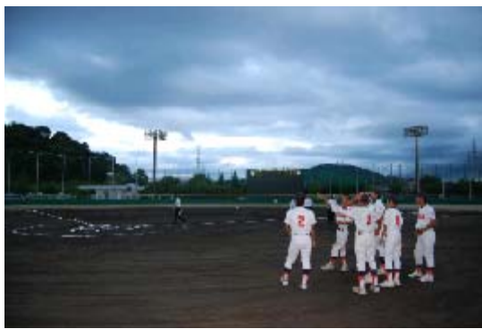
ナイター照明点灯前～期待！