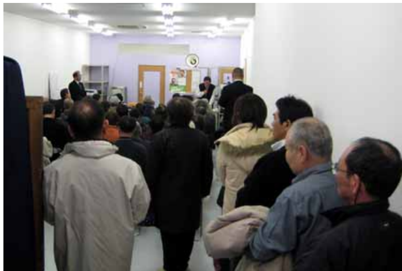
「明るい会」大東連絡会事務所開き：6日午前赤井に