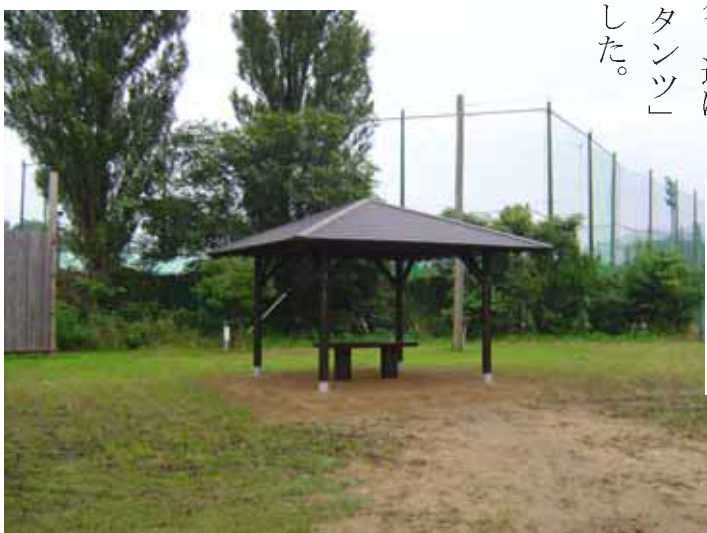
賛助会の寄付で完成した東屋